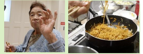
栄養科主催の“ライブクック”！ メニューは“焼きそば”でした 「昔は、急いでいるときは“焼きそば”を作っていたの、みんな大好きでしょ」と笑顔でお話いただきました