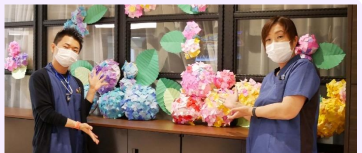
リハビリ課のメンバーがロビーに飾り付けしました