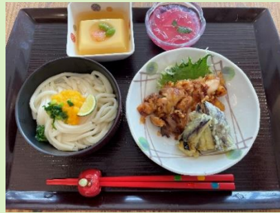
つるつると、美味しくいただきました