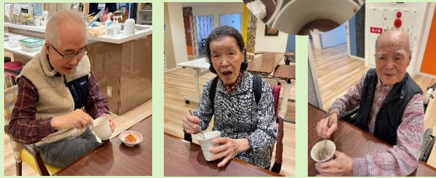
今年春に入職したメンバーの企画でみなさまに顔と名前を憶えていただきたく先輩職員と企画しました