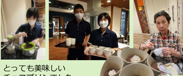
とっても美味しい チョコプリンでした